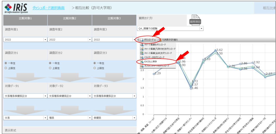
Excelダウンロードデータ